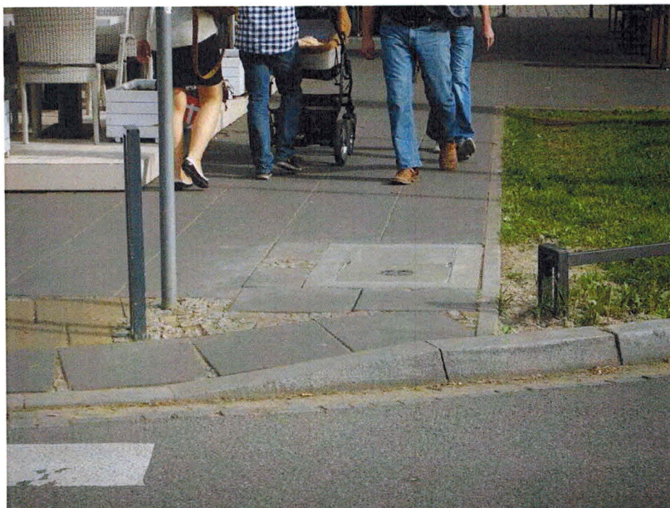
Wąskie przejście między „ogródkiem” a trawnikiem na ul. Francuskiej